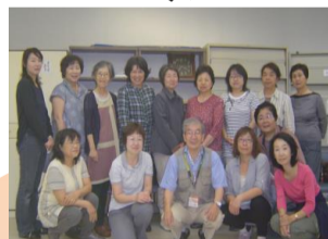
ヘルパーさんと一緒に

サービス提供責任者 3名、介護福祉士 5名、ヘルパー1級 2名 ヘルパー2級 20名