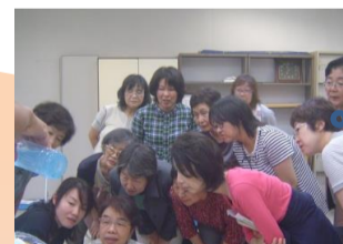
ある日の研修会風景