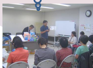
技術研修会ひとこま