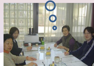
チームミーティングのひととき